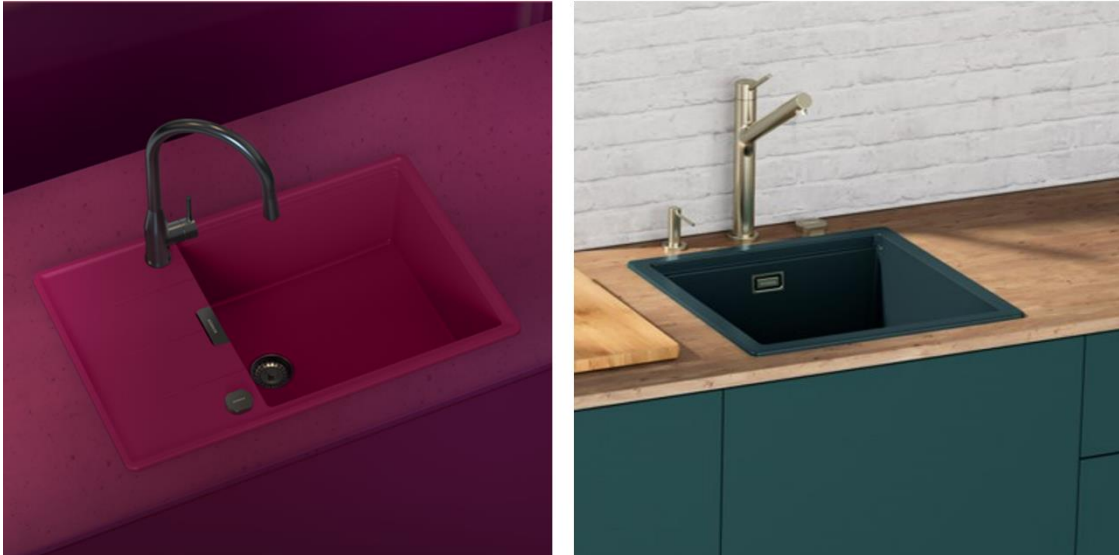
Frischen Farbwind bringen die CRISTADUR® Farbe Berry sowie die CRISTADUR® Green Line Farbe Ivy ins Spiel.